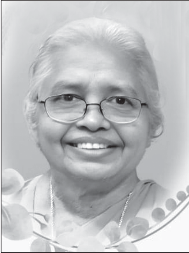
സി. ഹലേന SDS (മേരി) കൊമ്പനത്തോട്ടം