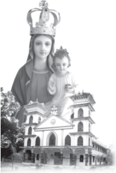
നിർമ്മലാംബികേ ഞങ്ങൾക്കുവേണ്ടി രചപേക്ഷിക്കണമേ